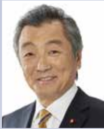
松本 純氏 (国土強靱化担当大臣)