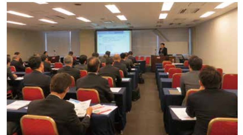
レジリエンス認証説明会の様子(2016年11月札幌で開催)