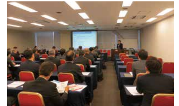
レジリエンス認証説明会の様子(2016年11月札幌で開催)

ジャパン・レジリエンス・アワード (レジリエンスジャパン推進協議会開催)との広範囲な連携