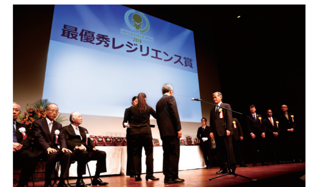
アワード受賞の様子(レジリエンス認証取得団体の多くが受賞しています)